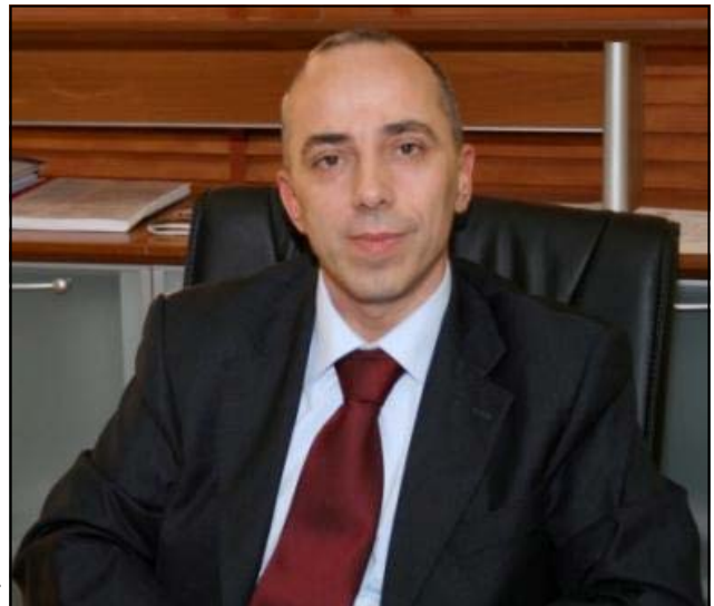
Z. Lutfi Zharku, Ministër i Tregtisë dhe Industrisë

Përgjithësisht diskutimet janë përqendruar ne aspekte te shkëputura te CEFTA-s, sidomos ne liberalizmin e tarifave doganore me vendet e rajonit. Mirëpo ne te vërtete, duke qene një marrëveshje me një natyre shume-dimensionale, CEFTA është shume me tepër sesa thjesht një marrëveshje për tarifat doganore. Ne këtë aspekt, është shume e rëndësishme qe CEFTA te shihet ne një kontekst me te gjere dhe nga këndvështrime te ndryshme ne mënyre qe te kuptohet për atë fare ajo është ne te vërtete. Si fillim është i nevojshëm një shpjegim i shkurtër i përmbajtjes dhe qëllimit te CEFTA-s. Nga këndvështrimi politik, CEFTA është pjese e përpjekjeve te vendeve te rajonit dhe Bashkimit Evropian (BE) për te krijuar një treg rajonal qe mundëson zhvillimin ekonomik dhe qe do e kontribuojë eventualisht ne rritjen e sigurisë dhe stabilitetit politik ne Ballkan.